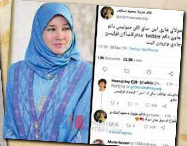
'Mulai hari ini saya akan menulis dalam Jawi' – Tuanku Permaisuri Agong